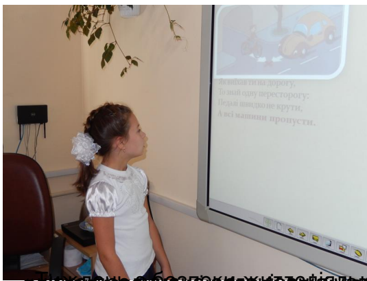
під час проведення уроку з теми «Безпека на дорозі» діти виконали практичні завдання, які допомогли їм краще зрозуміти правила безпеки на дорозі.