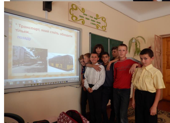
Вчителька організувала проведення вікі-відеоуроку з теми «Правила дорожнього руху»