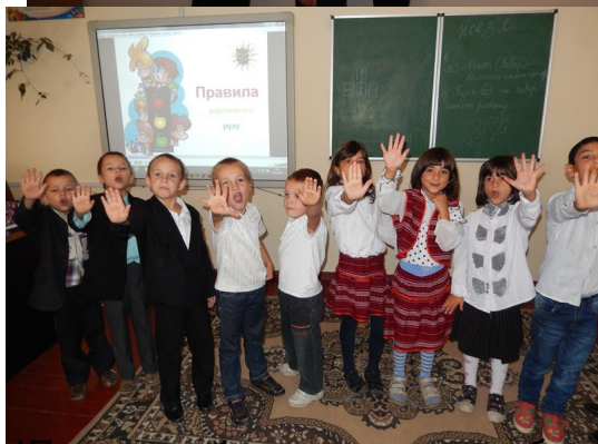
Під час проведення уроку діти виконали практичні завдання, які допомогли їм краще зрозуміти правила безпеки на дорозі.