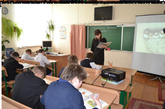
членкиня школи в гостях у польських класів узяв участь на уроку українського мови в Польщі