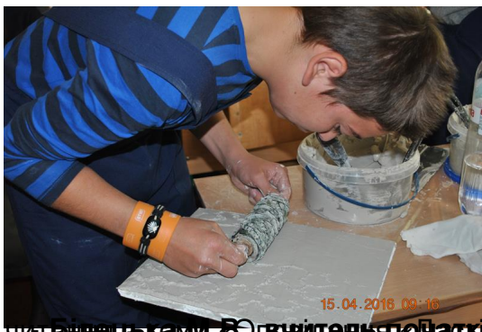
членкиня школи в гостях у польських класів узяв участь на уроку українського