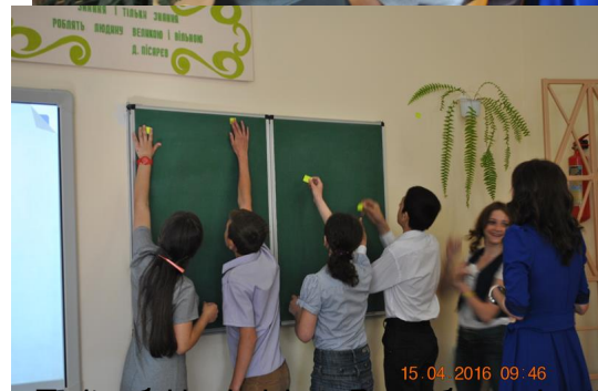
Між іншим, було обговорено питання організації роботи з дітьми з особливими освітніми потребами, а також про умови формування вмінь