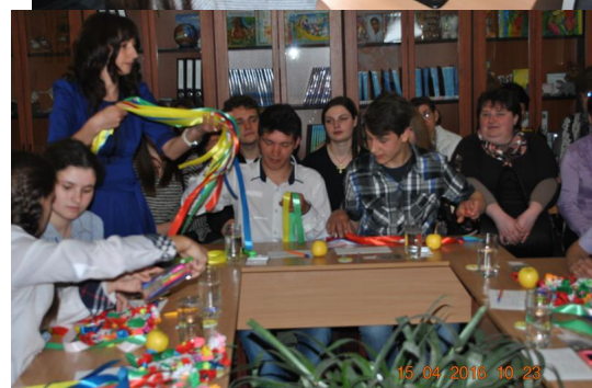
Будучи надією на подальше співробітництво, було обговорено питання про можливість організації подальшого співробітництва між школами. Матеріали