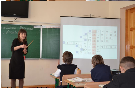
вчителька української мови в Польщі, яка працює в школі, провела урок української мови в Польщі