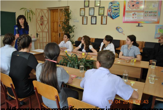
Відомості про методику роботи з дітьми з особливими освітніми потребами, а також про умови формування вмінь